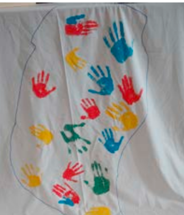
„Weltgebetstag mit Kindern“ Familientag in der Reformierten Kirche