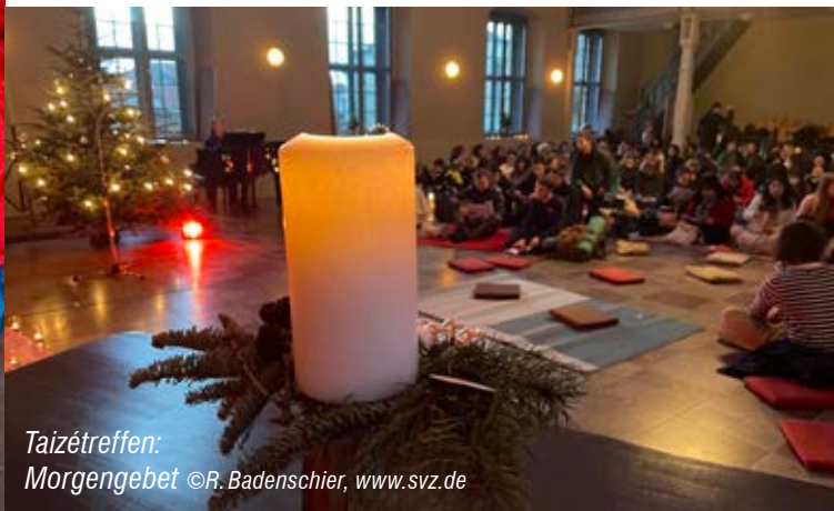
Taizétreffen: Morgengebet